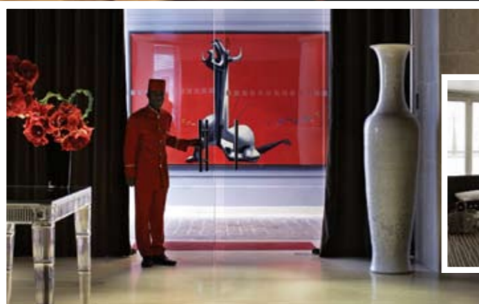
الصورة الرئيسية وداخل الإطار: فندق إنتركونتيننتال باريس أفينيو ماركو.

عندما يفكر الناس عادة بفنادق باريس فإنهم يتخيلون قصوراً ملكية في مبانٍ تاريخية يكسوها من الداخل ورق ذهبي ويغطي أرضياتها السجاد الفلمنكي، وفيها مطاعم راقية تقدم ما لذ وطاب لنزلائها من السياح الأثرياء والمشاهير من نجوم السينما ورجال الأعمال البارزين. وربما كان منبع هذه الصورة من شهرة مدينة النور بفنادقها الفخمة، مثل ريتز وموريس وجورج الخامس. لكن من المؤكد أنها أصبحت اليوم أكثر شهرة بما توفره من خيارات أفضل لجميع الزوار مع ظهور موجة جديدة من الفنادق العصرية التي تتميز بطابع فني فريد من نوعه ومزايا ستغير من مفهوم السفر إلى باريس.